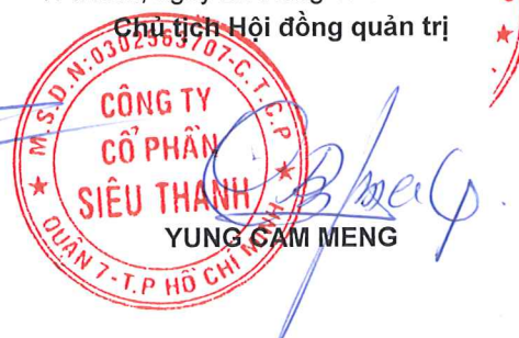
YUNG CAM MENG